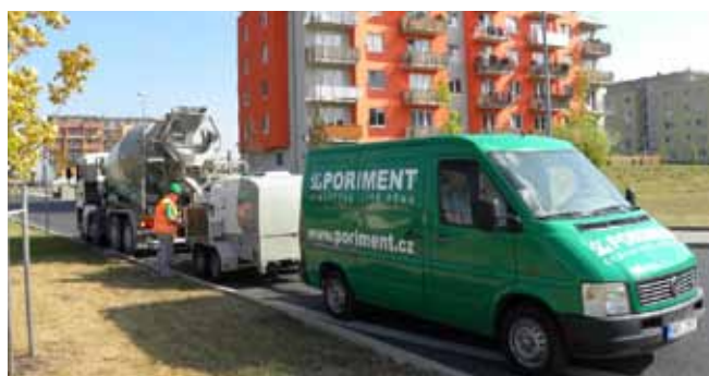
■ PORIMENT® - výrobní technologie na stavbě