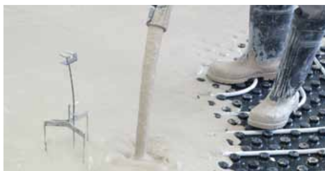
■ ANHYMENT® - realizace lité podlahy