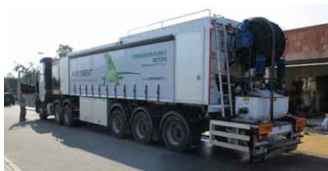
■ ANHYMENT® - mobilní výrobní zařízení na stavbě