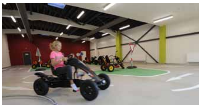
■ CEMFLOW®Look - architektonické řešení podlahy