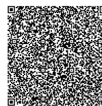
Betonárna Velké Meziříčí