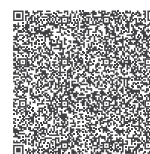
Betonárna Moravské Budějovice